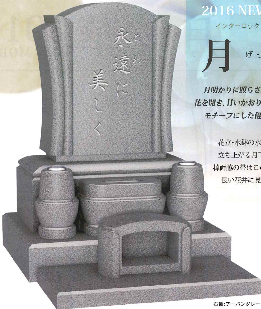
石種:アーバングレー

花立・水鉢の水平ラインから立ち上がる月下美人を表現。棹両脇の帯はこの花の特徴的な長い花弁に見立てました。